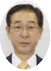
津久見市長 川野 幸男

一般国道217号平岩松崎バイパス(第I期工区)及び市道道箆合ノ元線開通にあたり、一言、あいさつ申し上げます。この国道・市道バイパスは、大分県、津久見市が連携を図り、平成22年度に着工し、それから10年の歳月を経て開通に至りました。市道バイパスの総事業費は約20億円ですが、その事業費