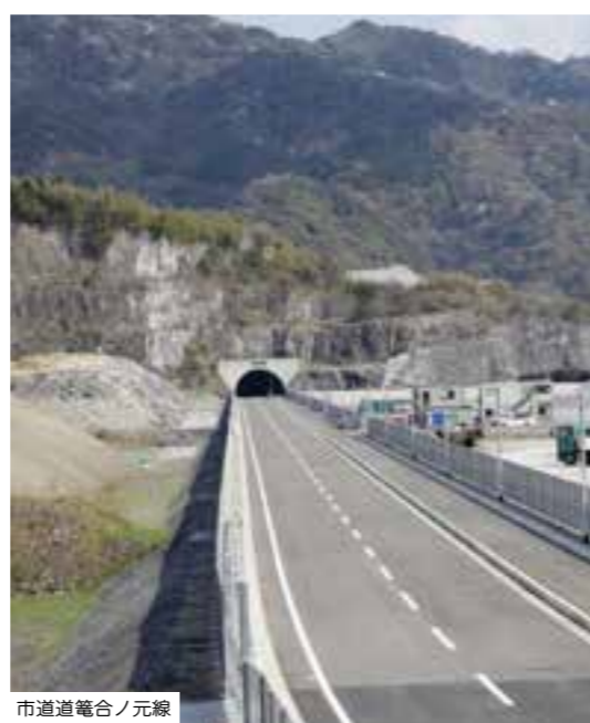
市道道箆合ノ元線